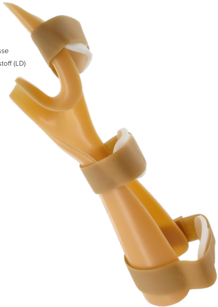
Maßtabelle – Halbzirkuläre - Handgelenkorthese