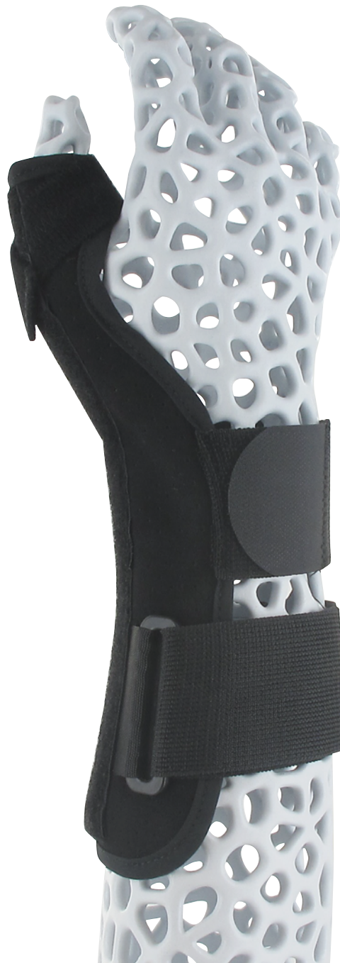
Maßtabelle – Suede - Daumenorthese