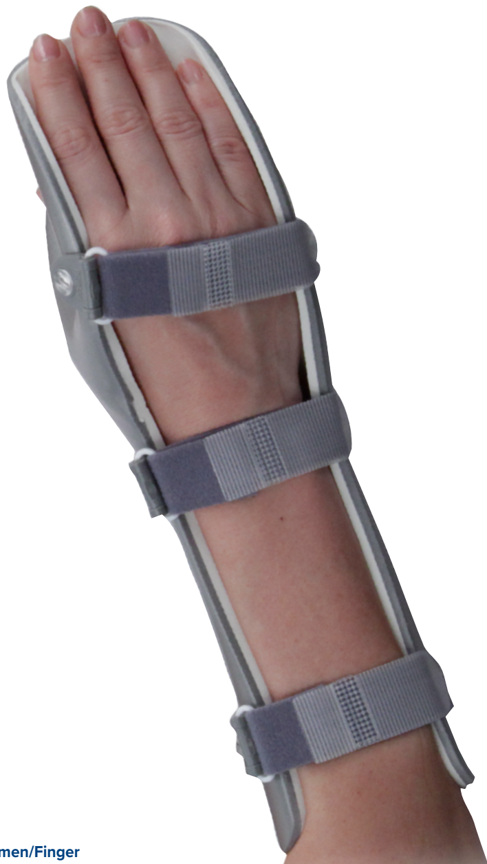
Maßtabelle – Passive - Handgelenksorthese mit Daumen/Finger