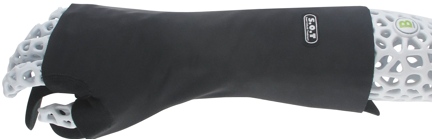
Maßtabelle – S.O.T - Handlagerungsschlinge