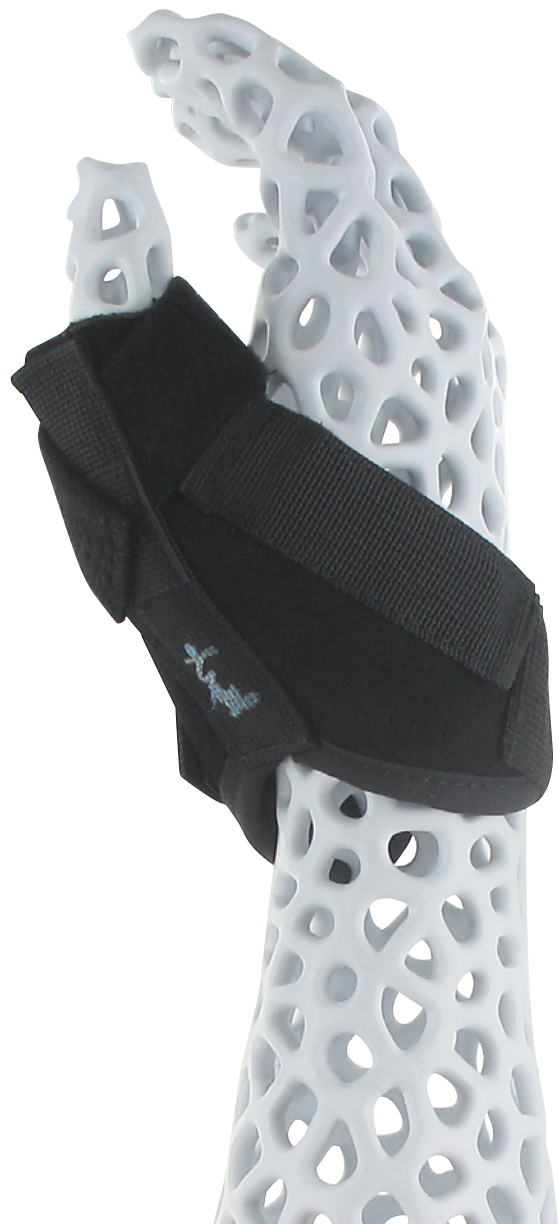
Maßtabelle – Tee Pee - Daumenorthese