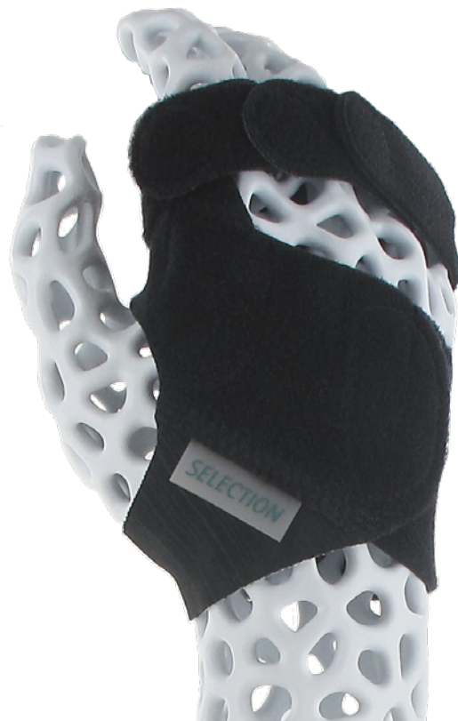
Maßtabelle – Selection Ulnar Deviation - Orthese