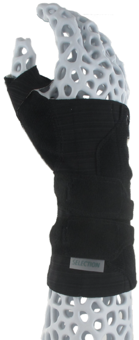
Maßtabelle – Selection Wrist Rigid - Handgelenkorthese (mit Daumen)