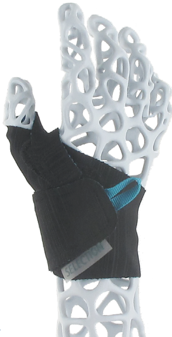
Maßtabelle – Selection Thumb - Daumenorthese für Kinder