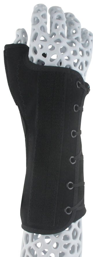
Maßtabelle – Ryno Lacer 2.0 - Handgelenkorthese mit Daumen