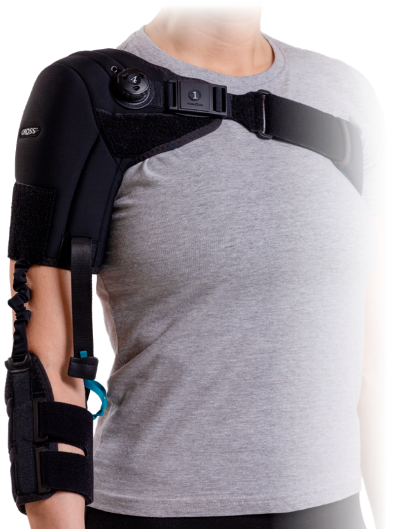
Maßtabelle – CROSS Hemi Schulterorthese