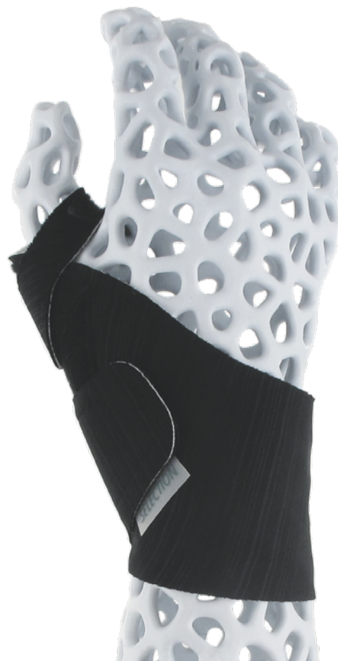
Maßtabelle – Selection Thumb - Daumenorthese