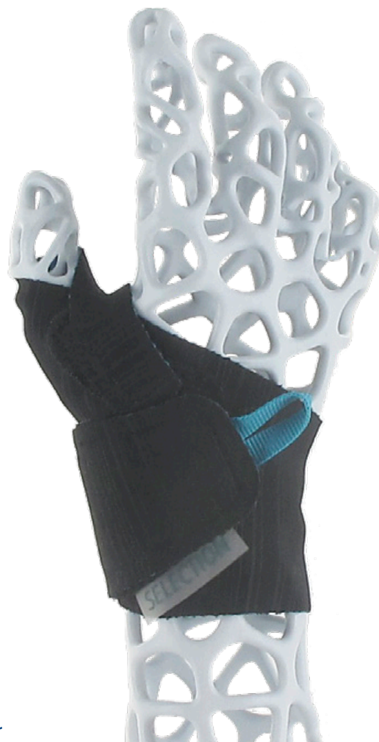
Maßtabelle – Selection Thumb - Daumenorthese für Kinder